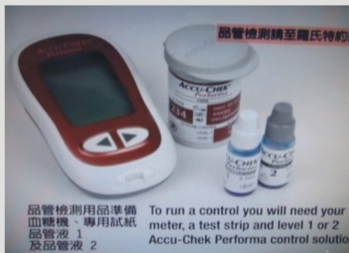
品管檢測用品準備 血糖機、專用試紙 品管液 1 及品管液 2

『有一天一位先生氣沖沖跑進來詢問，你們是不是賣我過期的試紙！？明明前幾天才剛買，怎麼會不能量出現過期的符號？』衛教師仔細查看這位先生的血糖機和試紙發現，試紙確實還未過期，但是在檢視血糖機發現，血糖機上的日期跑掉了，年份竟然已經是未來日期！對血糖機來說被誤設了未來日期 2104.12.01，若碰巧使用的血糖試紙剛好到期時間是2113.03.12，對血糖機來說確實是過期試紙當然就會跑出過期的異常符號了。經過設定正確的日期時間，就可以使用了。