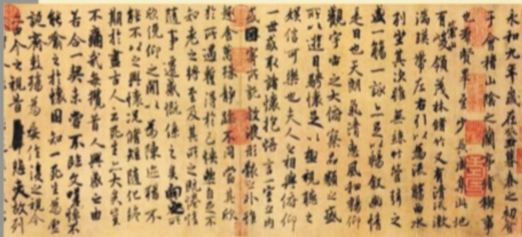
附圖1. 蘭亭序(摹本)，唐朝馮承素臨摹，又稱「神龍本」(資料來源：web.arte.gov.tw)

話說東漢時期(西元25年至220年)，書寫字體以〈隸書〉為盛行，俗稱漢隸。魏晉南北朝時代，又稱為三國兩晉南北朝(附註1)。初期的書體仍然是以隸書為主，後來民間對簡便書體的需求，漸漸對行書、草書、楷書等字體如雨後春筍般發展。