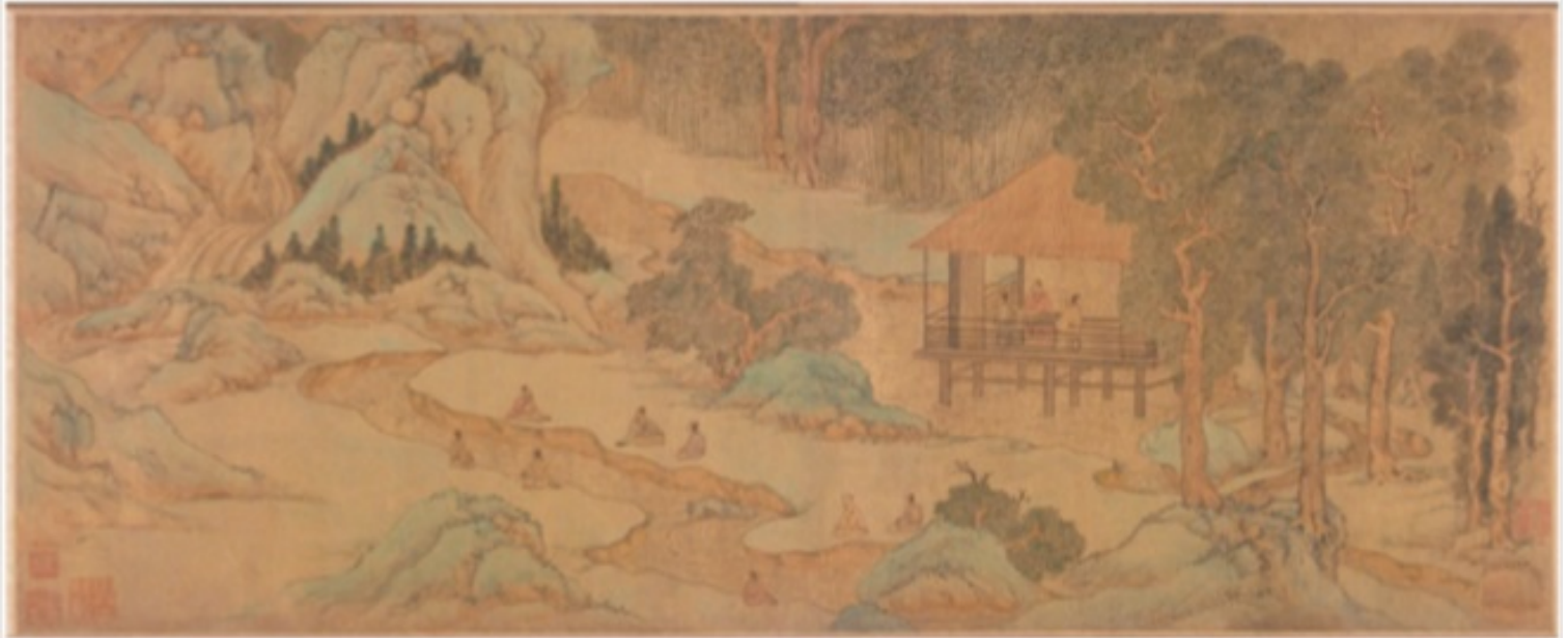
附圖2. 蘭亭修禊圖，明代文徵明繪

國立故宮博物院與高雄市立美術館合辦〈流觴曲水之樂〉特展，展出日期自109年9月7日至109年12月1日止，以天下第一行書，運用故宮典藏(定武蘭亭真本)營造當代雅集盛會情景，以數位科技表現、虛擬實境VR、多媒體影片、沉浸式環場劇場等方式呈現特展內容，擴充了博物館和觀眾互動機會，體驗審美的新視野，值得觀賞。